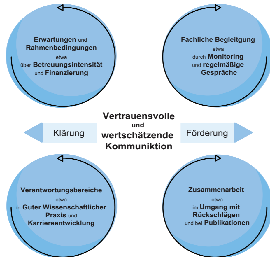
Abb. 1: Gute Kommunikation im Betreuungsverhältnis

Die Basis für eine erfolgreiche Zusammenarbeit zwischen Betreuenden und Promovierenden ist ein von wechselseitigem Vertrauen geprägtes Betreuungsverhältnis, in dem der fachliche Rat der Betreuer*innen ebenso wie die selbstständige Forschung der Promovierenden gleichermaßen geschätzt wird. Zentral und unabdingbar ist dabei eine offene und wertschätzende Kommunikation zwischen den Beteiligten. Unabhängig von dem jeweiligen Betreuungsmodell – ob etwa im Rahmen einer klassischen Eins-zu-eins-Betreuung oder einer Betreuung im Team – bilden Betreuer*innen und Promovierende eine Forschungsgemeinschaft, die im Optimalfall für alle Beteiligten eine Win-win-Situation darstellt: Die Betreuer*innen investieren viel Zeit in ihre Promovierenden. Sie begleiten sie durch die gesamte Promotionszeit, geben fachlichen Rat und unterstützen sie umfassend in ihrer wissenschaftlichen Entwicklung zu eigenständigen und kreativen Forschenden. Die Promovierenden wiederum leisten mit ihrer Forschung einen zentralen Beitrag zum wissenschaftlichen Erkenntnisfortschritt und tragen dadurch nicht zuletzt den Ruf ihrer Betreuer*innen in der wissenschaftlichen Gemeinschaft weiter.