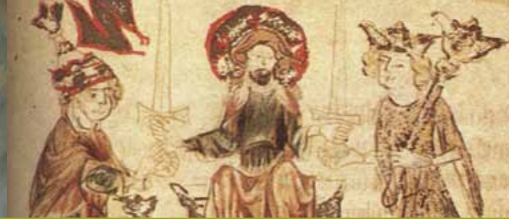
Zweischwerterlehre im Sachsenspiegel (um 1220)