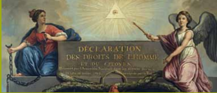
Die Menschenrechte unter dem Auge Gottes (1789)

Bekannt ist von all dem indes nur wenig: Lange Zeit haben nicht nur dogmatische Juristen, von denen ein säkulares Selbstverständnis erwartet wird, sondern auch Rechtshistoriker den Einfluss von Religion auf das Recht ausgeblendet und dabei die Verrechtlichung des Religiösen sowie außerstaatliche Institutionalierungsprozesse ignoriert. Erst in der jüngeren Generation von Rechtshistorikern, für die die interdisziplinäre Arbeit mit Philologen, Historikern, Theologen und Soziologen selbstverständlich geworden ist, hat sich das geändert. Unsere Ringvorlesung macht deshalb genau das spannungsreiche Verhältnis von Religion, Recht und Politik in der Rechtsgeschichte zum Thema. Dabei konzentrieren wir uns auf die europäische Geschichte, nehmen diese aber in einer Langzeitperspektive – von der Spätantike bis in den Vormärz – in den Blick.