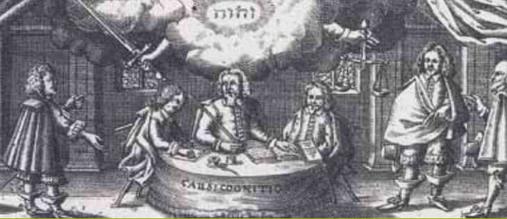
Das ordentliche Gerichtsverfahren (17. Jahrhundert)